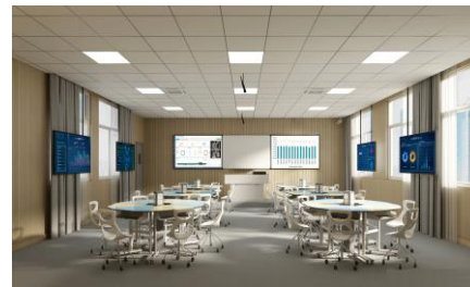
高职教互动教学解决方案