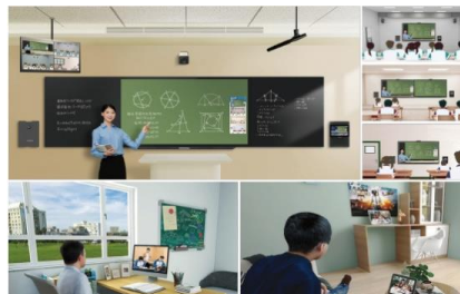
“三个课堂”解决方案