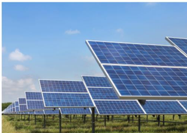
应用场景：光伏发电

新能源变压器主要应用于光伏发电等领域，产品主要包括：配套于光伏逆变器的高频磁性器件、应用于光伏发电电网的升压变压器以及其他电能转换产品。高频磁性器件是光伏逆变器设备储能和能源转换的核心元器件，公司产品具有噪音小，稳定性高等特点，已连续几年为国内知名主流光伏逆变器厂商大批量供应。光伏升压变压器是光伏电站中升压并网的关键器件，公司产品具有转换效率高，稳定性好，恶劣环境适应力强等特点，广泛应用于国内外众多光伏电站。凭借过硬的技术实力、产品质量和规模化的生产能力，公司也是国内较早打入美国、日本、欧盟等主要光伏市场的厂商。