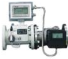
工业智能燃气流量计（控制器）