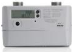
商业超声波燃气表