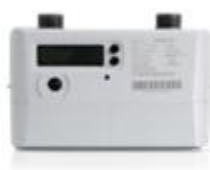
民用超声波燃气表

超声波计量仪表是利用超声波在介质中传递的时间差进行计量的新型计量仪表，它是一种高可靠性、高精度、带温压补偿的全电子式仪表。公司充分运用超声波计量技术精度高、易于实现智能化等特点，向运营商提供全电子一体化的先进计量解决方案，满足运营商对计量终端设备长期保持计量准确度的要求，凭借实时温度补偿、耐低温、宽量程等技术优势，改善运营商供销差问题，全面解决日常计量、用气安全监测、漏损监测等需要。