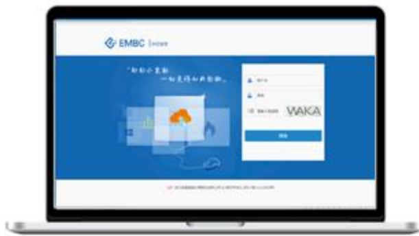
燃气云客户管理系统