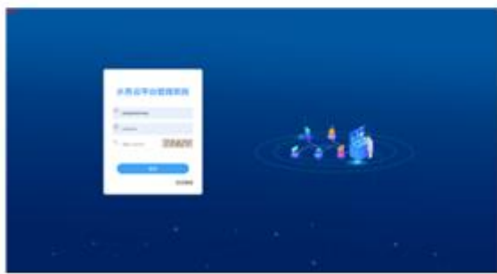
水务云客户管理系统