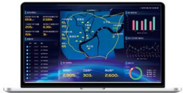
燃气云客户管理系统