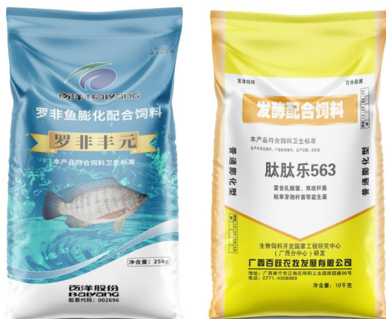
公司“罗非丰元”系列产品及配套的“肽肽乐”发酵配合饲料

公司通过优选营养和基于mTOR调控技术，开发出了能提高包产和出肉率，并缩短养殖周期、改善肉质的饲料新品“罗非丰元”系列。该系列产品2021年在海南、广西等地进行塘口验证时，获得了养殖户的一致好评。“罗非丰元”系列产品计划于2022年正式向市场推广，公司将借此促进饲料与加工业务之间的协同联动，来进一步发挥饲料环节的优势，除了有助于夯实公司在国内罗非鱼水产加工行业的领军优势，还有益于养殖终端更好地降低养殖成本、提高养殖效益。