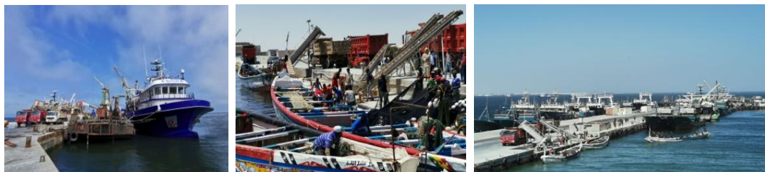
公司位于毛利塔尼亚努瓦迪布自贸区的远洋渔业项目

未来，公司将继续做大做强主营业务，依托产业链完整优势，致力于打造全球优质水产品供应商，积极开拓国内、国际市场，不断向产业上、下游进行拓展和完善。