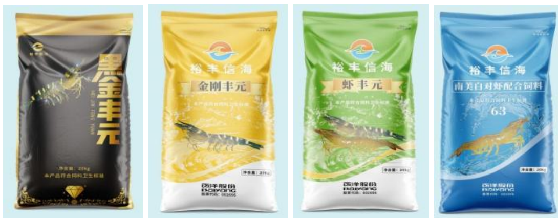
“裕丰信海”品牌部分虾饲料产品

虾饲料产品是公司未来重点发力的产品品类之一。目前已开发出了“黑金丰元”、“金刚丰元”、“虾丰元”等一系列产品，能够满足金刚虾、白对虾、斑节对虾等不同虾种的养殖需求，能够适应高位池高密度养殖、土塘低密度养殖、土塘鱼虾混养、低温冬棚养殖等不同养殖环境模式。公司的虾饲料产品具有耐水性好，诱食性好，料肉比低等优点，能够有效提高对虾体质和成活率。