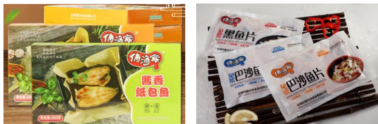
公司“俏渔家”牌系列部分产品

近两年来，在疫情影响下，国内小包装分割菜、预制菜等产品迎来发展的机遇。因此公司食品事业部组建专门的内销团队，开始发力国内冷冻水产食品业务。目前已形成“贝丰”牌、“俏渔家”两个系列产品。“贝丰”牌系列产品已拥有免浆黑鱼片、免浆脆口鱼片、火锅脆鱼片、馋嘴一口蟹、三鲜蟹排五个品种，目前主要在江浙沪及安徽地区销售。“俏渔家”系列产品已拥有免浆带皮巴沙鱼片、免浆去皮巴沙鱼片、免浆黑鱼片三个品种，目前主要在广东、广西地区销售。公司还开发了海鲈鱼、金鲳鱼的深加工产品以及金汤脆脆鱼、纸包鱼和腌制烤鱼等预制菜产品，未来将加强与餐饮连锁企业在预制菜等产品上的研发。