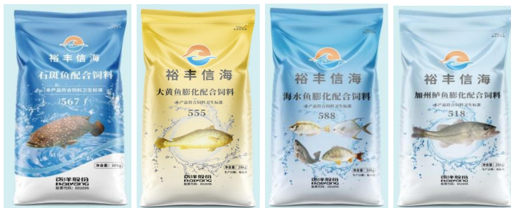
“裕丰信海”品牌部分特水料产品

公司饲料业务板块包括百洋产业投资集团股份有限公司饲料分公司、广西百跃农牧发展有限公司、海南百洋饲料有限公司、佛山百洋饲料有限公司等大型饲料生产企业。公司业务围绕水产养殖过程中需要的产品和服务展开，覆盖各类产品的研发、设计、生产、销售、服务等全部业务环节。公司严格按照ISO9001:2008质量管理体系和美国BAP认证体系，对所有生产流程、管理流程实行标准化、规范化和专业化管理。