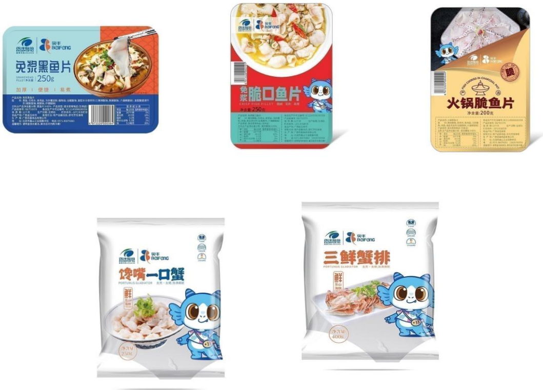
公司“贝丰”牌系列产品

近两年来，在疫情影响下，国内小包装分割菜、预制菜等产品迎来发展的机遇。因此公司食品事业部组建专门的内销团队，开始发力国内冷冻水产食品业务。目前已形成“贝丰”牌、“俏渔家”两个系列产品。“贝丰”牌系列产品已拥有免浆黑鱼片、免浆脆口鱼片、火锅脆鱼片、馋嘴一口蟹、三鲜蟹排五个品种，目前主要在江浙沪及安徽地区销售。“俏渔家”系列产品已拥有免浆带皮巴沙鱼片、免浆去皮巴沙鱼片、免浆黑鱼片三个品种，目前主要在广东、广西地区销售。公司还开发了海鲈鱼、金鲳鱼的深加工产品以及金汤脆脆鱼、纸包鱼和腌制烤鱼等预制菜产品，未来将加强与餐饮连锁企业在预制菜等产品上的研发。