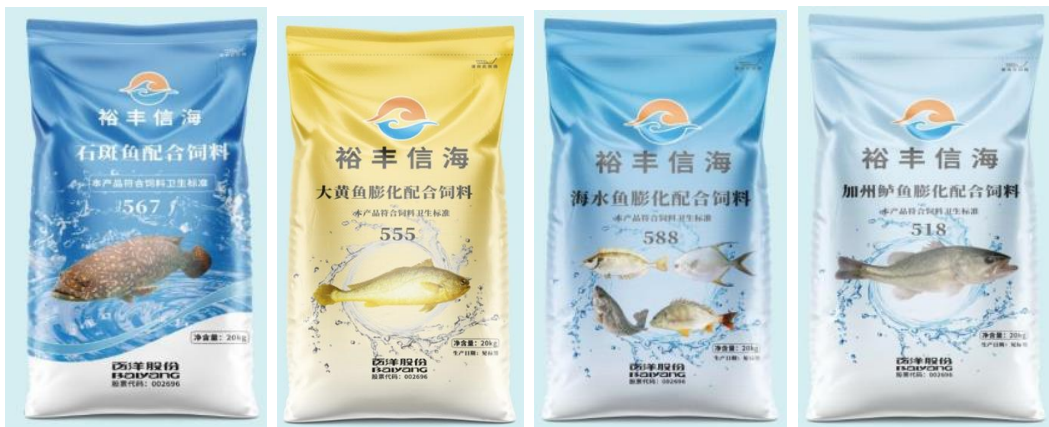
“裕丰信海”品牌部分特水料产品

公司特水料产品营养充足，氨基酸平衡，诱食性好，富含多种免疫性物质，鱼体发病率低，成活率高，行业口碑好。