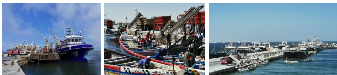
公司位于毛利塔尼亚努瓦迪布自贸区的远洋渔业项目

公司于2019年收购的远洋捕捞加工业务,该项目位于非洲毛里塔尼亚,主要由控股子公司日昇海洋资源开发股份有限公司(毛里塔尼亚)开展。毛里塔尼亚濒临大西洋,拥有超长的海岸线和宽阔的海洋专属经济区,鱼类资源丰富。公司以自有船队和合作船队捕捞的非深海鱼群和经济鱼作为原料,对渔获物进行加工处理。目前的产品主要为鱼粉、鱼油和其他经济鱼,此外还有章鱼、墨鱼、鱿鱼为代表的软体类海鲜产品。其中,鱼油和软体类海鲜产品主要销往欧洲的大型食品加工厂和餐厅;鱼粉是国内水产饲料生产过程中重要的动物性白质添加原料;其他经济鱼产则主要在邻近的非洲市场进行销售。