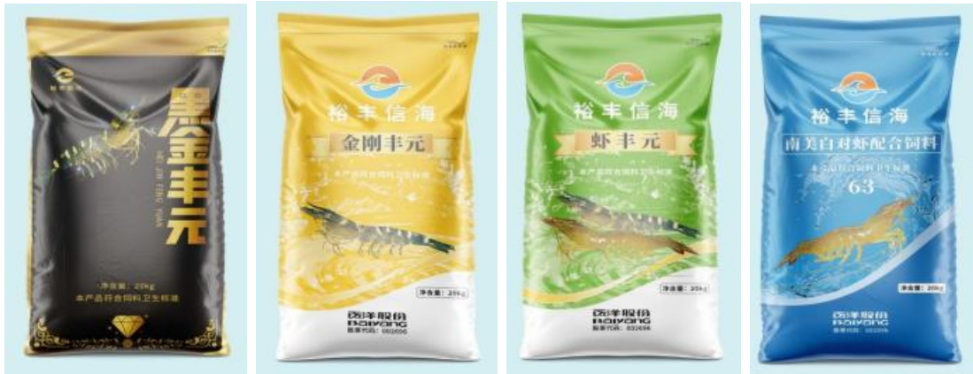
“裕丰信海”品牌部分虾饲料产品