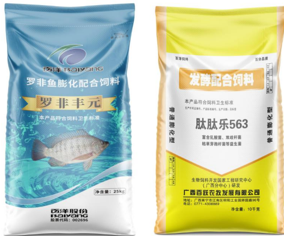
公司“罗非丰元”系列产品及配套的“肽肽乐”发酵配合饲料

已有的研究发现，哺乳动物雷帕霉素靶蛋白（Mammalian Target Of Rapamycin，以下简称“mTOR”）是生命感受营养和调控生长健康的关键点之一。在机体细胞中，mTOR信号通路能接收来自于营养、生长因子或者环境胁迫等信号，通过调控细胞的合成代谢和分解代谢，最终实现对细胞生长和生理活动的精确调控；其活性对于肌蛋白的沉积和肠绒毛的稳态至关重要，同时对非特异性与适应性免疫应答，抵抗细菌感染具有重要作用。进一步的研究表明，与陆生动物类似，在鱼类中mTOR通路也是调控体蛋白合成与生长的重要信号分子。因此，对水产动物的mTOR信号途径的研究成为近年来水产动物营养领域的热门，并已取得了一些研究成果。