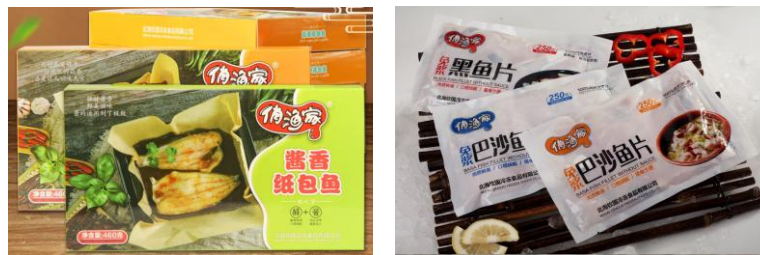
公司“俏渔家”牌系列部分产品

近两年来，在疫情影响下，国内小包装分割菜、预制菜等产品迎来发展的机遇。因此公司食品事业部组建专门的内销团队，开始发力国内冷冻水产食品业务。目前已形成“贝丰”牌、“俏渔家”两个系列产品。“贝丰”牌系列产品已拥有免浆黑鱼片、免浆脆口鱼片、火锅脆鱼片、馋嘴一口蟹、三鲜蟹排五个品种，目前主要在江浙沪及安徽地区销售。“俏渔家”系列产品已拥有免浆带皮巴沙鱼片、免浆去皮巴沙鱼片、免浆黑鱼片三个品种，目前主要在广东、广西地区销售。公司还开发了海鲈鱼、金鲳鱼的深加工产品以及金汤脆脆鱼、纸包鱼和腌制烤鱼等预制菜产品，未来将加强与餐饮连锁企业在预制菜等产品上的研发。