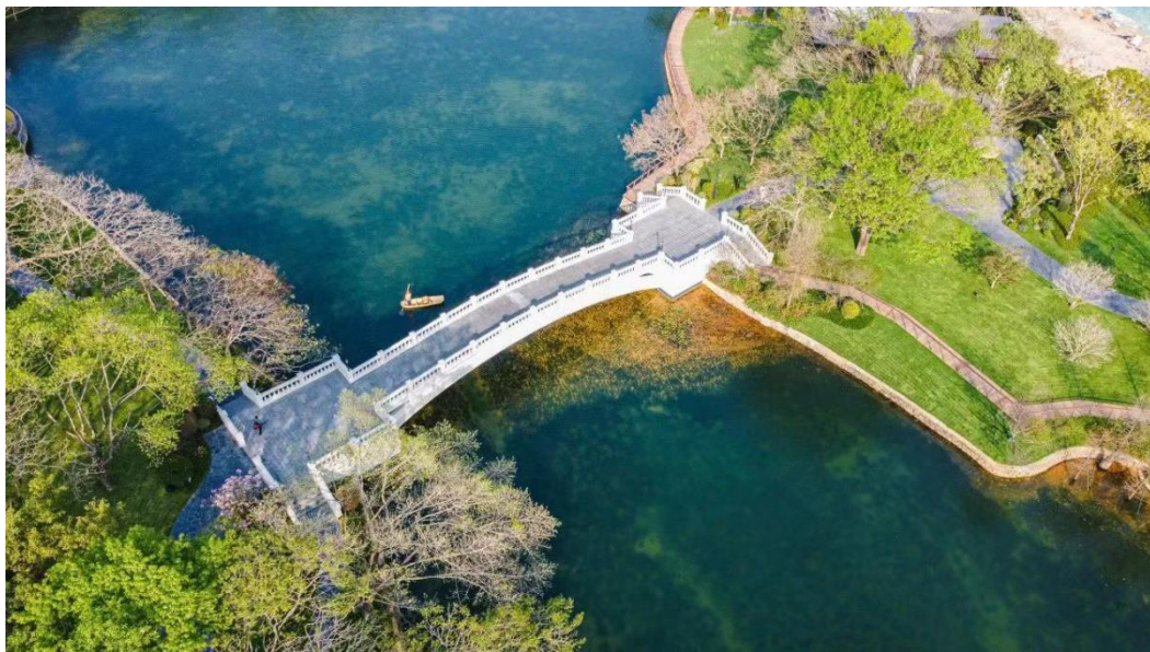
广州天河区世界大观一期月亮湖生态修复工程