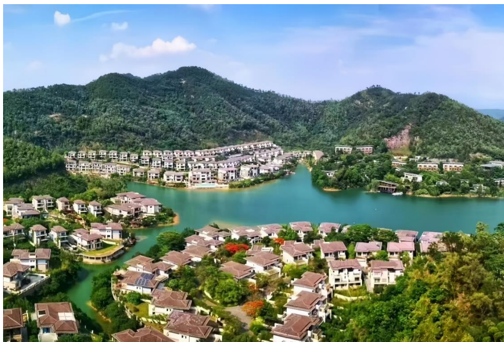
广州天湖峰境保洁绿化环境综合维护服务项目

近年来，普邦股份加快布局城市运营业务，构建起集“绿化养护、环卫保洁、城镇焕新、社区微改造、时花布置、基础设施维护、市容管理”等全方位的城市运营服务链条，助力城市形象全面提升。公司参股保利环境服务（广东）有限公司，与保利物业服务股份有限公司等共同布局两翼“垃圾分类+再生资源回收利用”及“园林绿化养护+市政基础设施维护”业务；与万物云城签订战略合作协议，双方将就全国各地城市空间内的城市运营相关领域相关项目的市场开拓、运营管理、项目实施等方面开展深度合作，有助于实现双方未来的市场扩张策略并获得市场份额，促进公司城市运营板块的发展，推动公司内生发展与外延扩张相结合，不断完善产业链布局，有利于进一步提升公司核心竞争力，巩固行业地位。