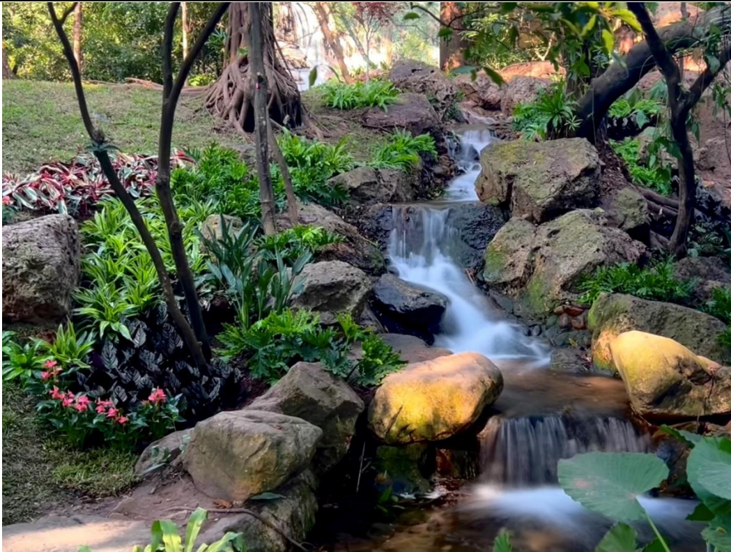
广州兰圃绿化养护项目