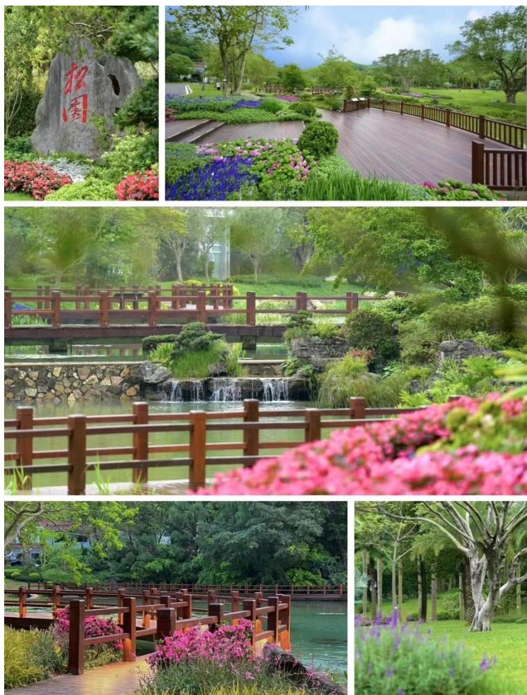
广东松园宾馆设计及工程项目项目

普邦设计是普邦股份经过多年实践沉淀和积累的专业设计平台，拥有 5 大设计院——旅游规划设计院、生态环境规划设计院、景观规划设计院、景观绿化设计院以及景观水电设计院，共有国际级高端智库和国内综合性人才近四百人。秉承“精品、创新、国际化”的品牌定位，凭借创新力、实现力、资源整合能力，以及全方位的设计管理体系，普邦设计服务于精品住宅、综合商业、城市空间、科教康养、特色文旅等领域，完成了一批具有行业标杆意义和时代特征的高端设计项目。其中，公司打造出设计施工一体化项目“代表作”——广东松园宾馆园林景观修缮提升，改造后的广东松园宾馆成为了国家主席与法国总统 2023 年 4 月 7 日非正式会晤的场所，其营造的岭南园林环境赢得了各界高度赞誉，为岭南园林乃至中国园林艺术争得了荣誉。除此之外，公司还承接了广州白云国际会议中心酒店群中轴景观的设计项目，采用抽象的手法重绘岭南的故事、聚会的意象，以此营造尊崇、威严、大气的景观空间，打造出国内最大的新岭南花园酒店。