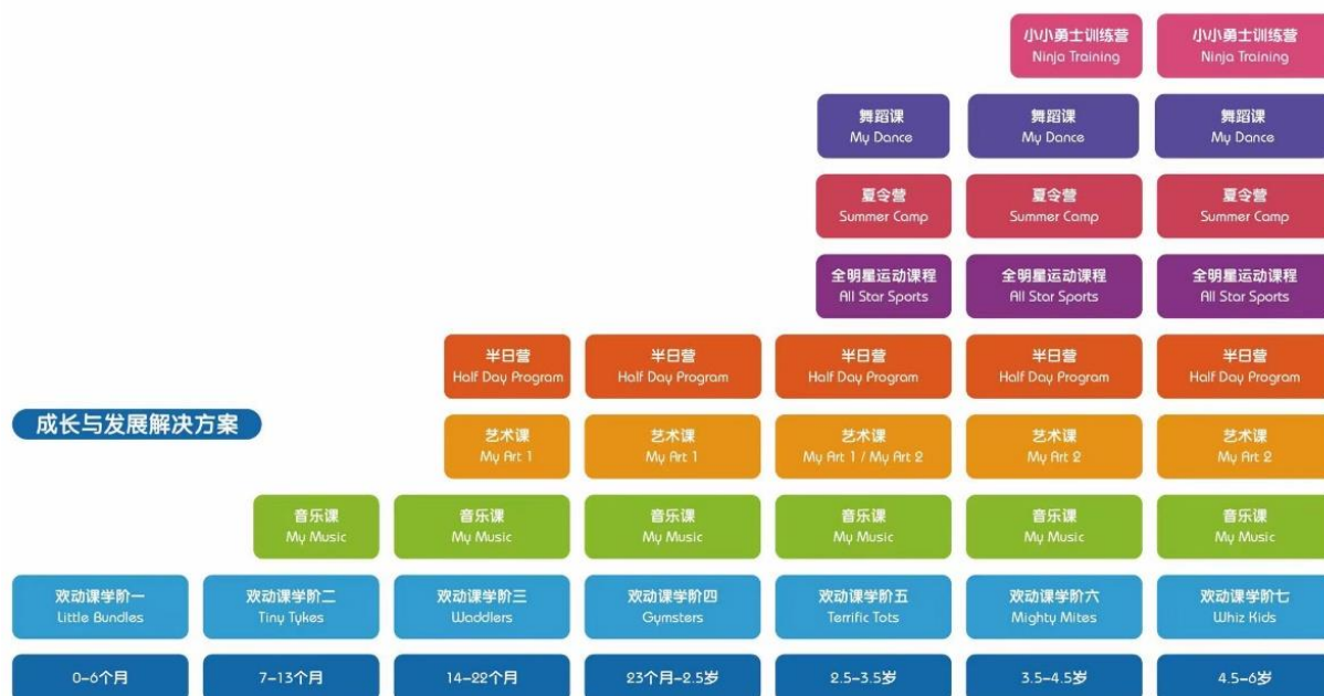
美吉姆适龄课程推荐