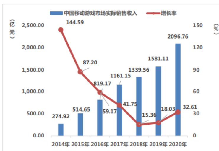
图7 中国移动游戏市场实际销售收入及增长率

近年来，随着手机的普及以及大数据、5G、人工智能、移动互联网等技术的发展，移动网络游戏呈现出快速发展的态势。从市场规模看，我国的移动游戏用户规模持续增长。根据中国音数协游戏工委（GPC）、中国游戏产业研究院联合发布的《2020年中国游戏产业报告》，2020年，中国游戏市场实际销售收入2,786.87亿元，同比增长20.71%，保持快速增长；我国游戏用户规模逾6.6亿人，同比增长3.7%。其中，中国移动游戏市场实际销售收入2096.76亿元，比2019年增加了515.65亿元，同比增长32.61%；中国移动游戏用户规模达6.54亿人，同比增长4.8%。从中国游戏市场份额占比看，移动游戏市场占比75.24%，客户端和网页分别占比20.07%和2.73%，移动游戏收入占据游戏市场主要份额。“游戏出海”规模进一步扩大，自主研发游戏海外市场实际销售收入154.50亿美元，同比增长33.25%，继续保持高速增长趋势，国际化水平进一步提升。此外，我国游戏产业政策环境不断优化，相关法律法规、制度规范陆续出台，游戏知识产权保护意识进一步提高，游戏产业生态环境不断完善。