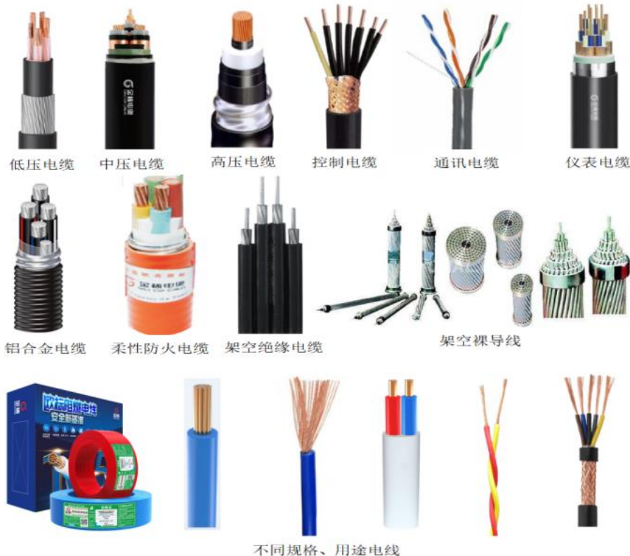
图：公司主要线缆产品

公司线缆产品广泛应用于智能电网、工业装备配套、轨道交通（高铁、地铁、磁悬浮）、民生及新能源汽车（车内高压线缆、充电桩）、风光储、安防、核电等有特殊要求的领域，以及各类建筑、家庭装修、公建装修及各类安防控制、电气设备连接、控制等基础领域。按下游应用领域来看，公司线缆产品应用于绿色建筑领域的客户主要是数量众多的广大经销商；应用于智能装备领域的客户有中国移动、三一、中联、徐工、卫华、中车株洲、中铁装备、铁建重工等；应用于重大工程领域的客户有中石油、中石化、中铁、中建、中交等；应用于清洁能源领域的客户有明阳、三一重能、中车风能以及终端汽车客户吉利、五菱等；应用于智能电网领域的客户有电网及地方电力公司等。同时为应对新市场需求的爆发，公司正在加大新兴工业应用领域线缆的研究开发，寻求第二增长曲线。