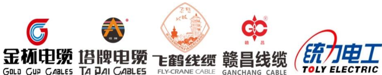
图：公司旗下扁电磁线及线缆品牌

品牌的形成是长期的点滴积累，需要从质量、价格、服务等方面赢得消费者的好口碑，这是进入电线电缆行业的壁垒，也是公司拥有的一笔宝贵的无形资产。公司各大品牌在各区域市场具有极强的号召力和影响力，拥有一批伴随品牌成长且忠实的经销商合作伙伴，构建了成熟牢固的经销商体系。