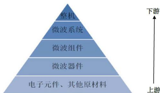
军工电子行业应用产业链

目前，公司产品包括微波器件、微波组件、分机子系统及多功能芯片。微波器件是单一功能的器件；微波组件是集成了芯片、微波器件等其它部件并采用微组装技术进行组合，实现一体化多功能的模块；分机子系统由多个微波模块组成，能够实现系统性功能。