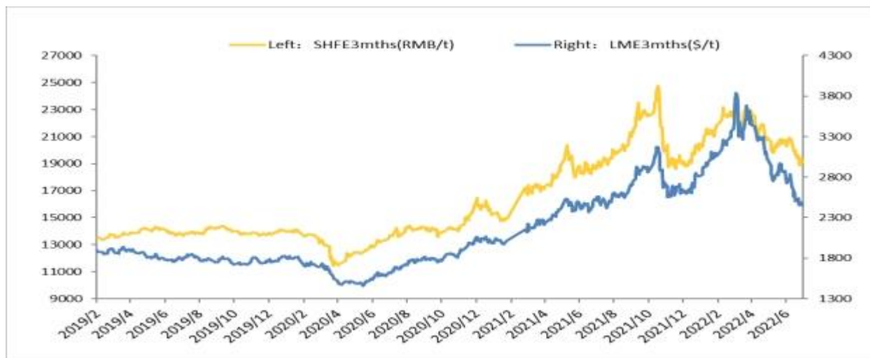
伦敦金属交易所和上海期货交易所铝价走势情况

2022 年国内铝价与外盘表现基本一致，呈现出先扬后抑的行情。3 月上旬之前，沪铝主力合约在外盘带动下大幅上涨至 24255 元/吨，距离去年高点仅有 510 元/吨；之后自高位回落，不仅全部回吐前期涨幅，且仍有继续下行之势。自春节之后，国内疫情便呈现出多点面广、持续时间长的特点，广西、吉林、上海、北京等区域内企业因疫情防控而停工停产，尤其是上海的工业和经济受疫情影响最大，对全社会物流、消费、供应、贸易等环节都产生了不利影响。在此情况下，铝消费持续萎靡不振，市场信心不足，导致铝价持续走低。2022 上半年，SHFE 现货和三个月期货的平均价分别为 21449 元/吨和 21406 元/吨，同比分别上涨 23.3%和 23.8%。（数据来源：安泰科）