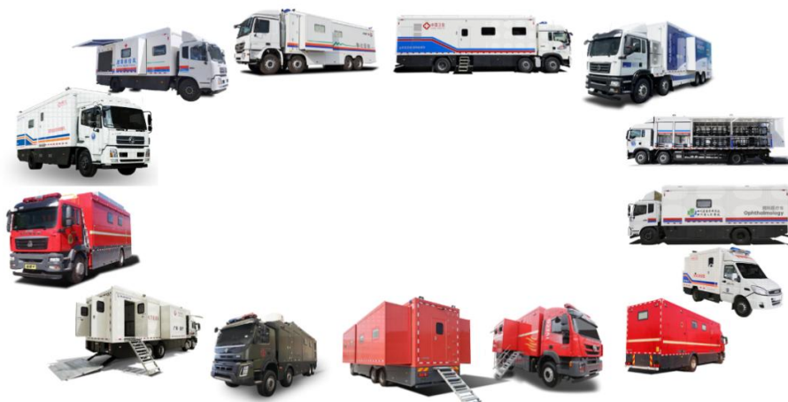
移动医疗保障装备示意图

术优势，产品性能达到市场领先，未来有望成为公司重要利润增长点。移动医疗装备从开始的单一产品（体检车）发展到至今，现已形成检验、影像、门急诊、手术、重症监护、防疫、后勤保障七大作业单元，具备先进的设计理念、成熟的制造工艺以及强大的特殊舱体研发能力，目前已经成为业内领先的方舱医疗车专业制造厂家，在移动CT车、移动生物实验室、5G卒中单元、车载CT储能电源等产品市场具有优势。现已具有配置全科甲级移动医疗和医疗应急处置能力，产品也正在向高端智能方向发展。