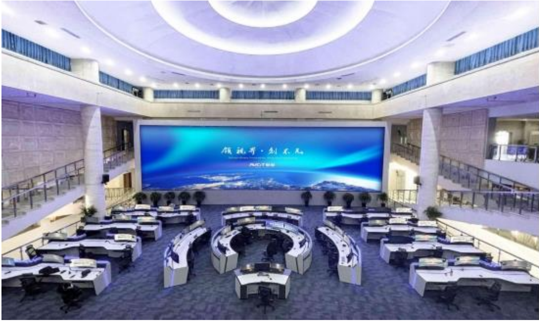
内蒙古某市智慧城市应急指挥中心，AI 智能技术，深化业务应用