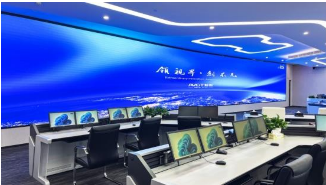
广州市白云区智慧城市运行中心，以分布式系统筑基，以 AI 智能应用赋魂

公司的分布式系统产品，实现了低延时、低带宽、低码率、高清画质的效果，并广泛服务于关乎民生发展和国家安全的诸多领域，应用于指挥中心、调度控制中心、会议室集群、监控中心、会商中心等业务场景，在应急管理、智慧城市、公安指挥、电力能源、轨道交通、司法监狱、气象三防、智慧医疗、智慧教育等领域广泛使用，并打造了众多优质案例。公司分布式系统解决方案应用于 COP15——《生物多样性公约》缔约方大会第十五次会议——大会五大核心指挥中枢，为大会顺利举办提供保障；公司为中国载人航天工程和探月工程的指挥控制中心提供了“光纤 KVMS 解决方案”，助力中国首次火星探测“天问一号”成功发射；公司为第七届世界军人运动会八大安保指挥中心完成分布式系统部署，打造了全方位的指挥网；公司分布式系统解决方案应用于广州市白云区智慧城市运行中心，赋能白云区城市运行数据汇聚、社会事件研判分析、联动指挥统筹协调；公司分布式+AI 智能解决方案为内蒙古某市智慧城市应急指挥中心提供了坚实的技术支持，大大提高了城市应急指挥能力；公司为某能源集控中心提供光纤坐席智能解决方案，助力其能源信息化、数字化、智能化改造升级，全面提高生产效率。此外，公司产品还应用于北京冬奥会、中国进出口博览会、世界人工智能大会、上海合作组织青岛峰会、亚洲基础设施投资银行、新加坡樟宜国际机场 AOC、国家级某大数据中心、广东省三防总指挥部、国网吉林省电力应急指挥中心、黑龙江省数字政府运营中心等诸多场景之中，受到用户的广泛认可。