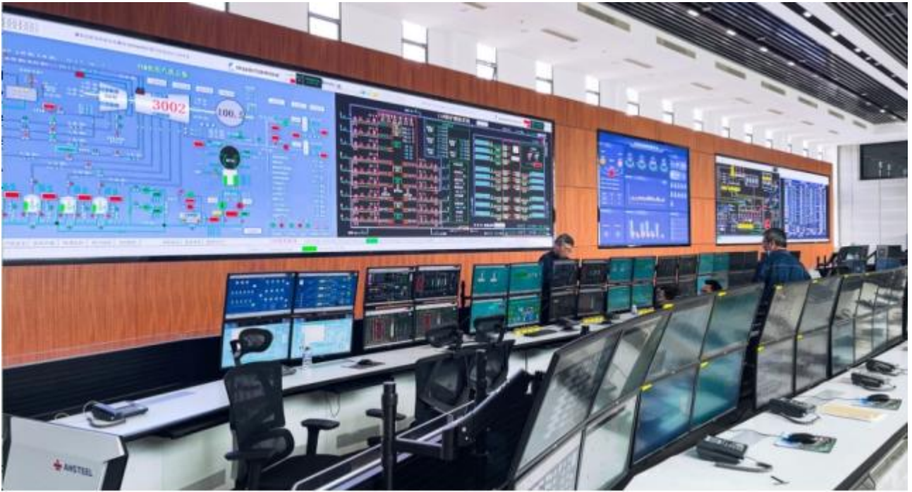
某能源集控中心，全面实现信息化、数字化、智能化升级改造