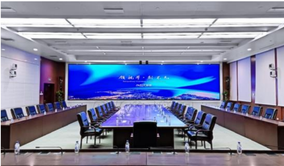
国网某省电力应急指挥中心，安全、稳定、可靠的智能化会商新体验，赋能风险精准研判、决策高效、上下联动