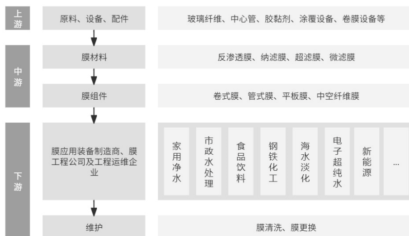
上下游产业链示意图

公司主要产品为膜产品，处于膜行业产业链的中游，膜行业上游产业链主要是制膜所需的化学原料、仪器仪表、涂膜设备、卷膜设备等原料、设备和配件制造行业，上游行业产品价格受市场供求和全球经济运行情况影响较大。下游产业链主要是膜应用装备制造、膜工程公司以及工程运维企业。膜材料和膜组件作为膜法水处理的核心部件，是决定下游工程产水水质的重要因素，下游行业的膜分离应用需求与国民经济运行状况、人民生活消费水平、健康饮水意识息息相关，同时，国家政策及行业标准也影响着下游行业景气度，影响中游膜产品及服务的需求、性能和价格变化。