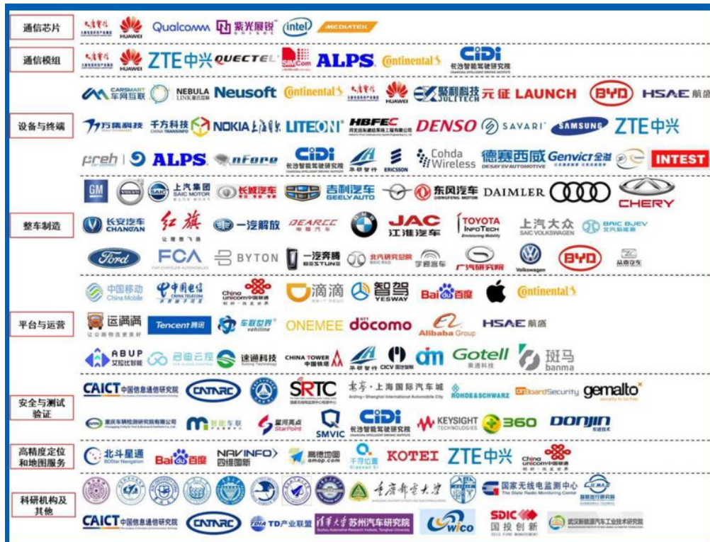
C-V2X 产业地图（来源：IMT-2020（5G）推进组《C-V2X 白皮书》）

2019 年 10 月 22 日，全球首次“跨芯片模组、跨终端、跨整车、跨安全平台”的 C-V2X 应用展示在上海汽车会展中心举行，该次实验展示由中国 5G 推进组 C-V2X 工作组、中国智能网联汽车产业创新联盟、中国汽车工程学会等牵头，聚集了整车企业（一汽、上汽、东风汽车、宝马、奥迪等 20 余家中外车企），芯片模组厂商（华为、中兴、大唐、国汽智联等 30 余家）、终端设备提供商（华为、万集科技等）、安全厂商和位路服务提供商参与验证，验证了国内 C-V2X 全链条技术标准能力，展现了国内 V2X 企业在全局的引领地位。“跨芯片模组、跨终端、跨整车、跨安全平台”，意味着我国已经形成包括通信芯片、通信模组、终端设备、整车制造、运营服务、测试认证、高精度定位及地图服务等为主导的完整 C-V2X 产业链生态。