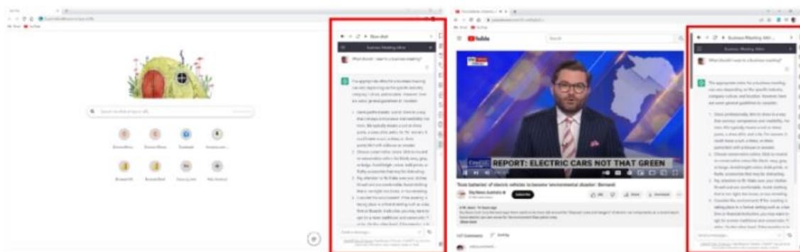
(Wave Browser 侧栏开发了快捷登陆功能)